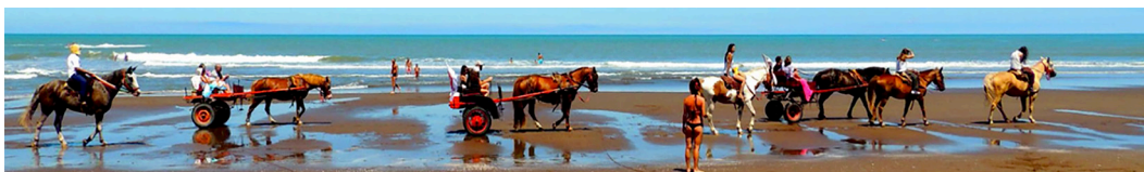
Foto 5. Cabalgatas y turismo de aventura para visitar el sitio "Las Patas".

el descubrimiento ocasional había sido tomado como espacio público, era difundido por diversos medios de comunicación nacionales e internacionales, y empezaba a ser visitado regularmente por turistas. Se comenzaron a organizar cabalgatas, excursiones en jeeps, y hasta se presentó el yacimiento como un nuevo atractivo que dispuso excursiones organizadas por agencias locales de turismo de aventura (Foto 5). Esta situación llevó a los preocupados funcionarios locales a ubicarme en mi tranquila estadía veraniega, con el interés de solicitarme, de forma urgente, mi intervención como profesional, teniendo en cuenta que era el único arqueólogo "disponible" en la villa balnearia.