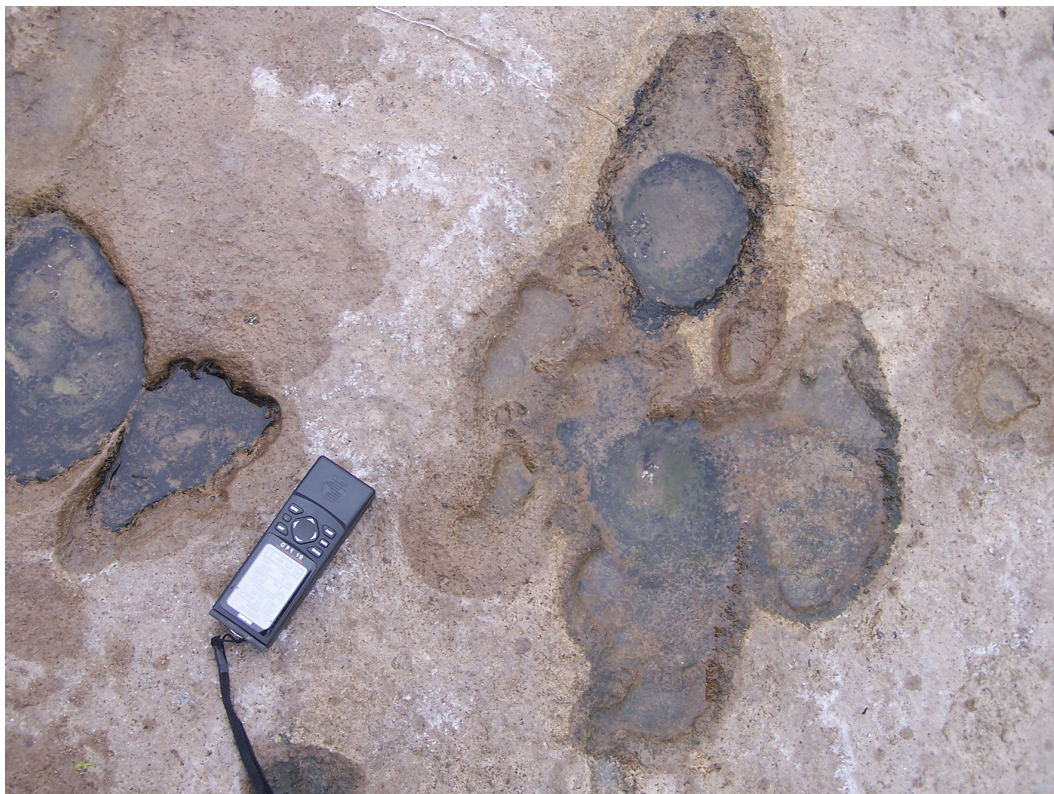
Foto 2. Huella humana asociada a huella de Lestodon. Autor: Miguel Mugueta.