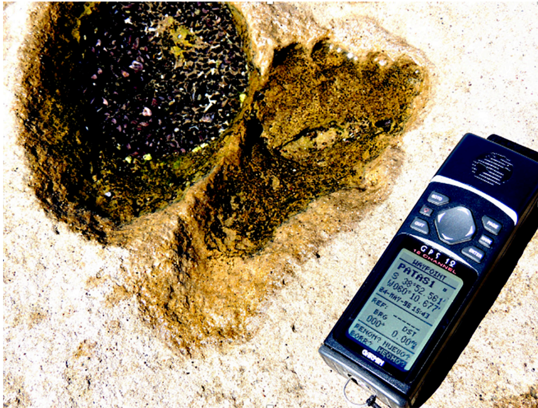
Foto 1b. Posicionamiento de coordenadas con GPS Garmin de una de las tres huellas humanas.

Una de las piedras del extenso afloramiento rocoso es de 2,10 metros por 1,30 metros en su dimensión plana y que queda al descubierto durante seis horas de la bajar y cuatro horas de la plenamar. Este elemento desta-