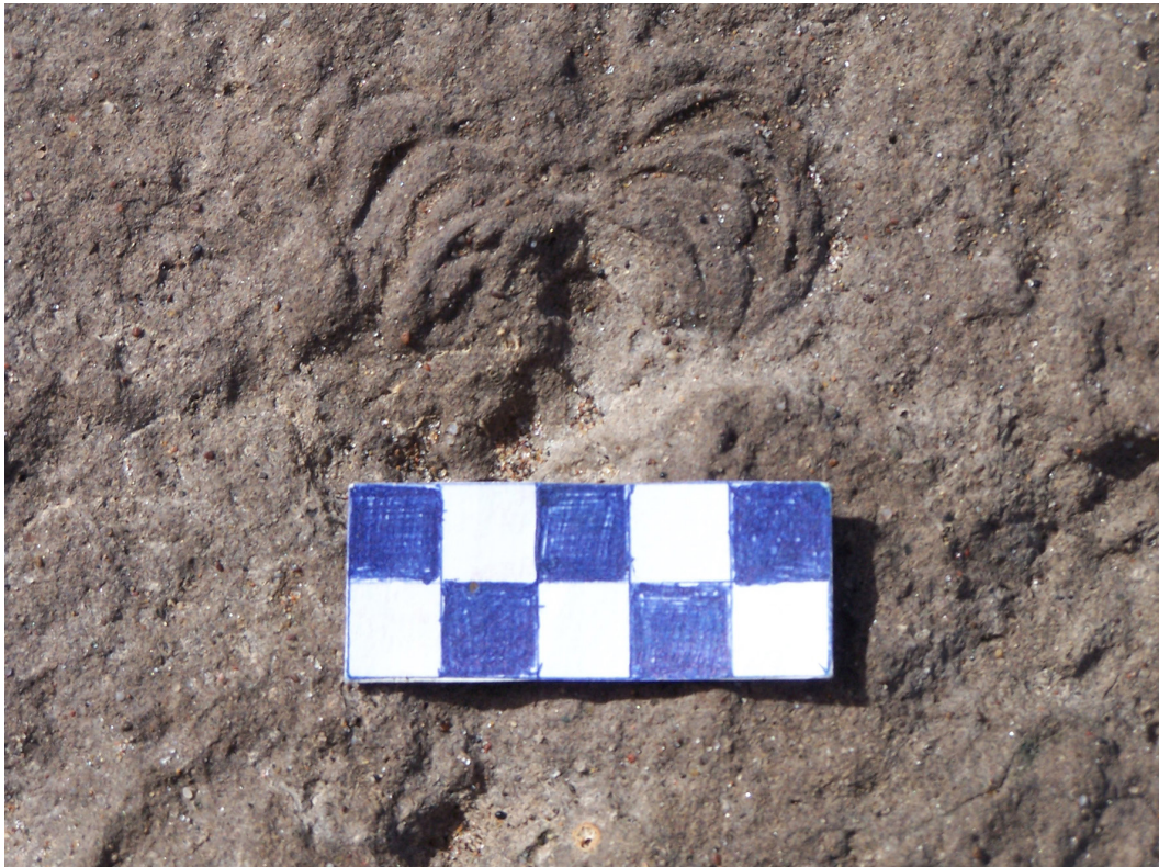
Foto 3. Impronta de cangrejo (familia: portudinae). Autor: Miguel Mugueta.

noestratigrafía o a la litoestratigrafía de los sedimentos. Esta categorización la afirma y lo utiliza por primera vez D'Orbigny para referirse a los depósitos de la llanura pampeana y Charles Darwin lo agrupa en la Formación Pampeana.