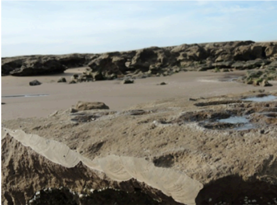
Foto 9. Se puede apreciar el primer corte en la roca producido con sierras neumáticas de alta precisión.

A partir de esta situación tuvo que intervenir la Dirección Provincial de Patrimonio, a cargo de la dirección provincial de Museos y Preservación Patrimonial, dependiente del Ministerio de Gestión Cultural de la provincia de Buenos Aires, a cargo en ese momento de Ricardo López Gottig, quien decidió separar al equipo de la UBA de la investigación, dando lugar al reclamo genui-