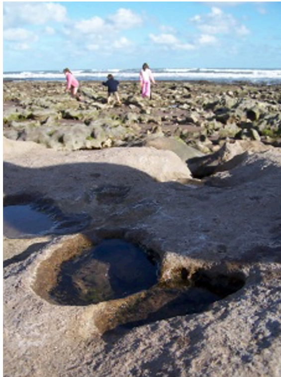
Foto 6. Contexto general donde se aprecia la huella mejor definida. Autor: Miguel Mugueta.

El trabajo comenzó con un reconocido paleontólogo de la UBA e investigador principal del Consejo Nacional de Investigaciones Científicas y Técnicas (Conicet), el doctor Carlos Azcuy, y por quien suscribe. Juntos iniciamos inmediatamente con un trabajo de campo en el área (esta incluía desde Monte