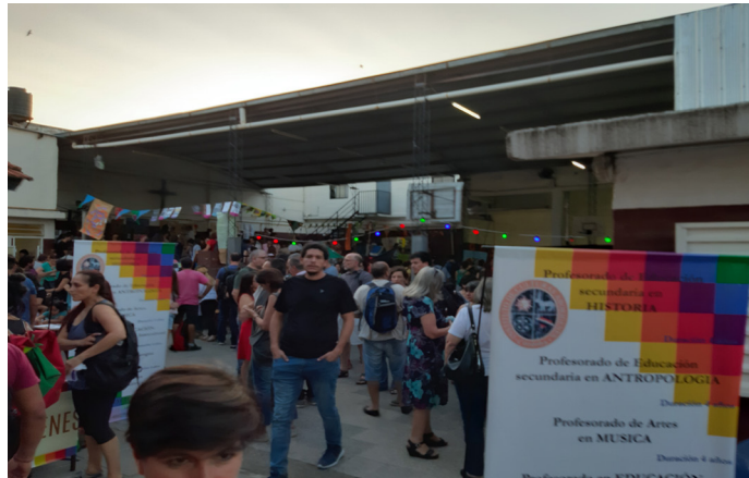
Apertura de la minga